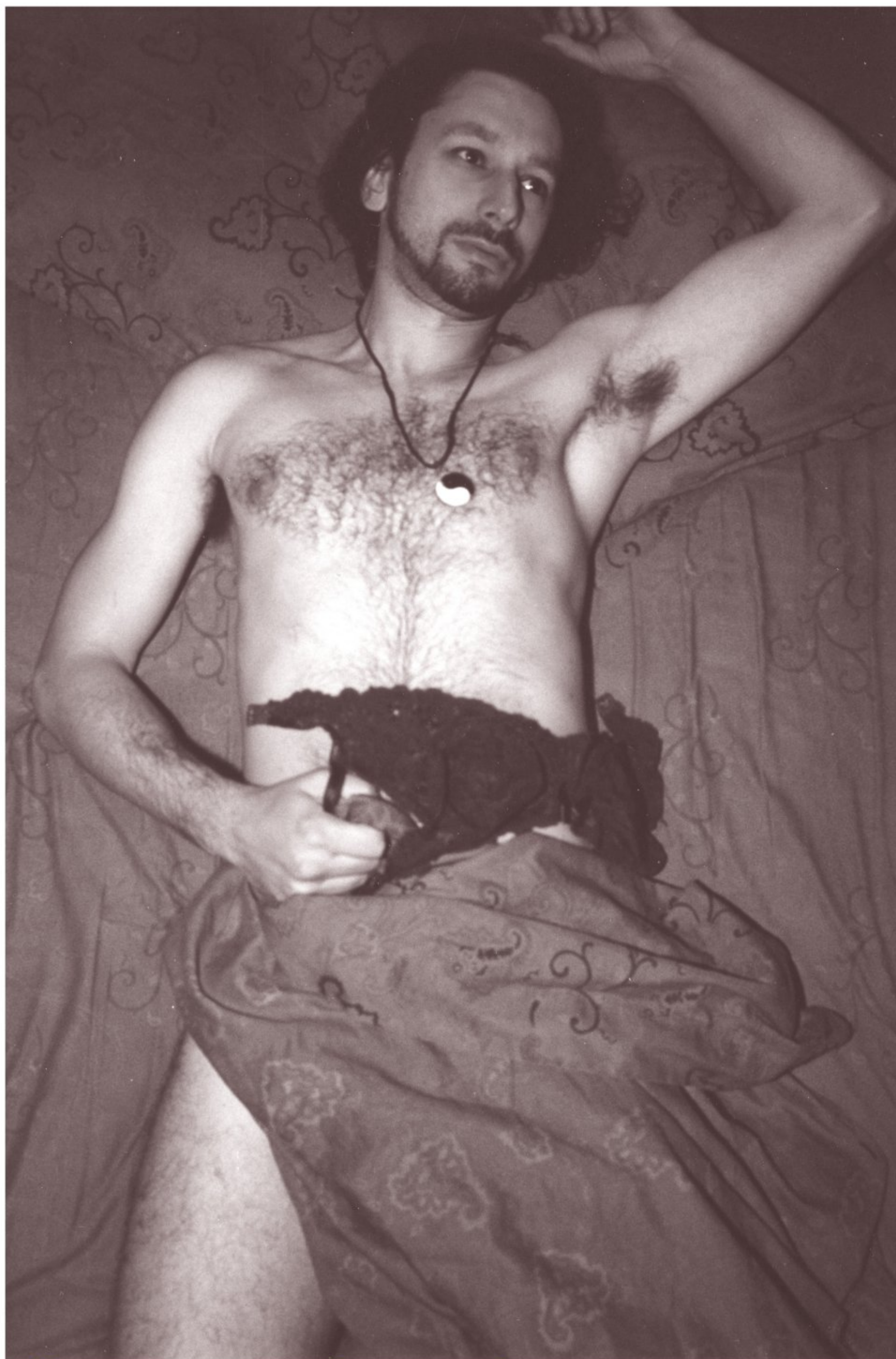
Omaggio a bunuel (Belle de jour-1967)